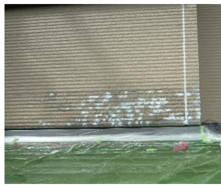
削った跡を補修材で埋めます