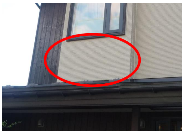
既存の外壁材同じに調色した塗料を塗って完成です

S： 今回は補修と塗装で済みましたが、ひどい場合は外壁の交換というケースもございますので、気づいたときはすぐにご連絡ください。