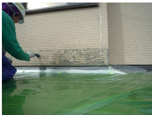
表面を削った後、シーラーを塗り乾かします

S： 調査の結果 思ったより浸食がないようなので、今回は表面を削り、補修して、同色の塗装で仕上げると修繕できます。