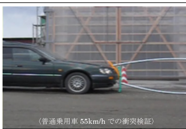
〈普通乗用車 55km/h での衝突検証〉