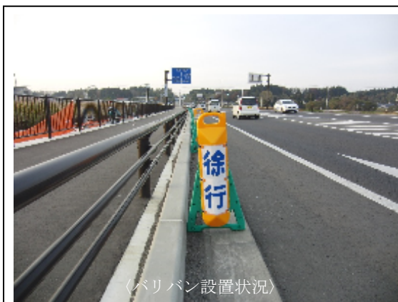
〈バリバン設置状況〉

「バリバン」は、工事現場などの単管バリケードに装着し、反射や標示シートにより通行者へ注意喚起を行うほか、車両衝突時の衝撃を緩和する効果もあり、単管パイプと追突車両との“突き刺さり事故”を抑制する商品です。