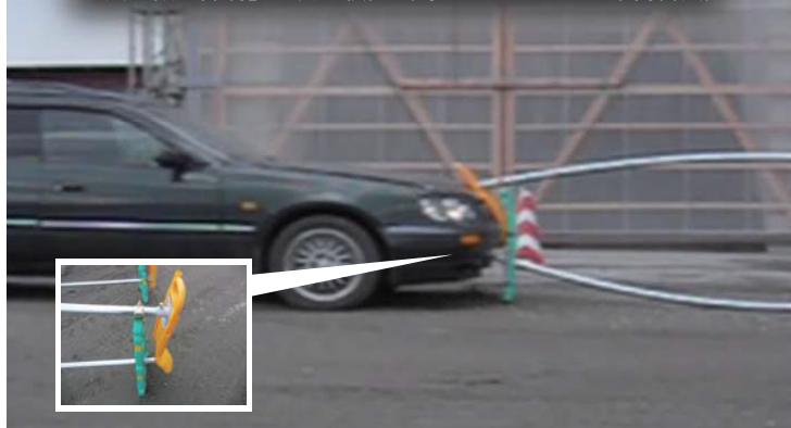
「突き抜け抑制」の安全検証 (時速 55km による車両衝突)